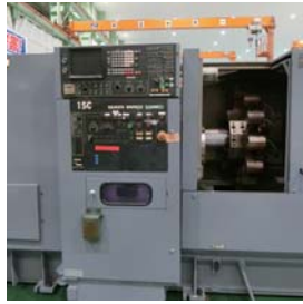
不支持网络的机械