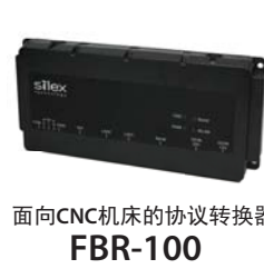
面向CNC机床的协议转换器 FBR-100