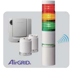
无线数据通信系统 WD-Z2系列